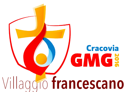
Villaggio francescano - 5 minuti