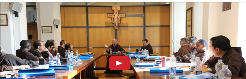
Foto - Incontro dei nuovi ministri