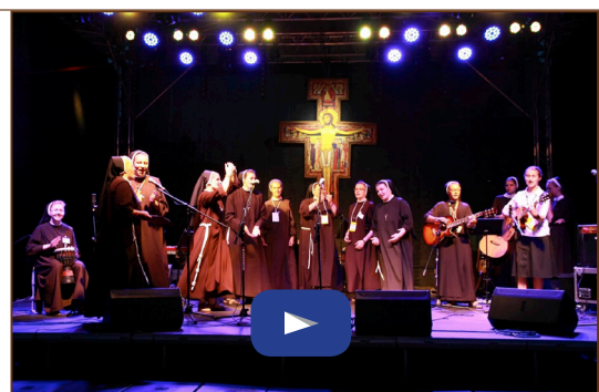
Villaggio francescano - 30 minuti