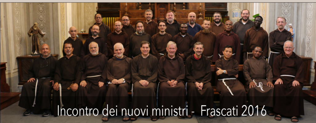
Incontro dei nuovi ministri - Frascati 2016