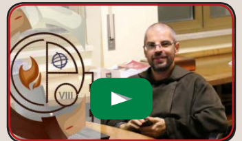
Riflessioni e testimonianze