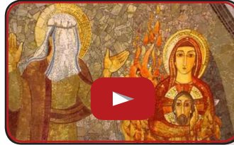
Carmelo Tonino Saia