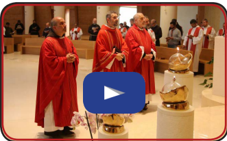
Collegio San Lorenzo