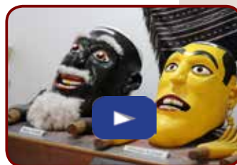
Berastagi, il museo