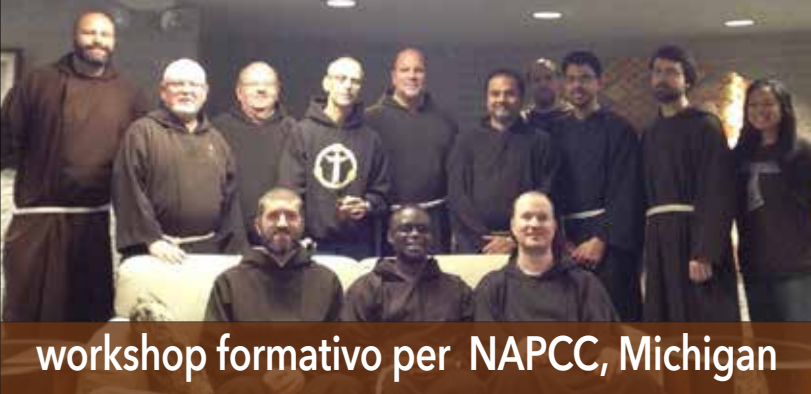
workshop formativo per NAPCC, Michigan