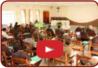
PACC n 1