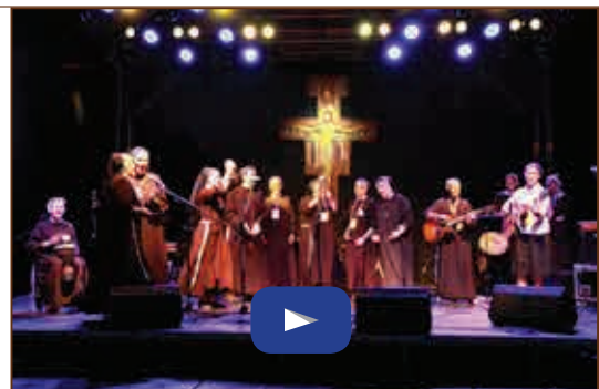
Aldea Franciscana - 30 minuti