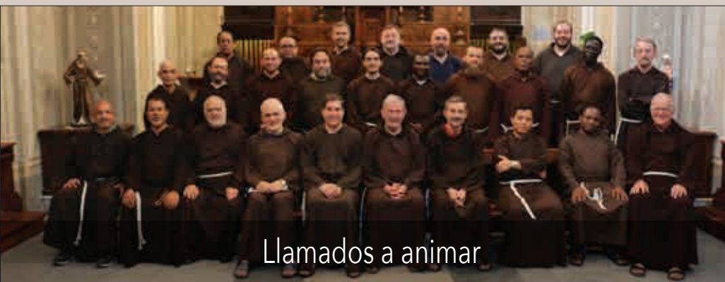
Llamados a animar