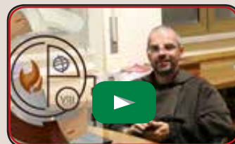
Riflessioni e testimonianze