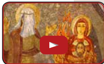
Carmelo Tonino Saia