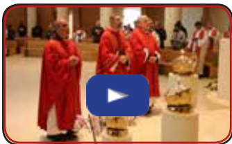
Collegio San Lorenzo